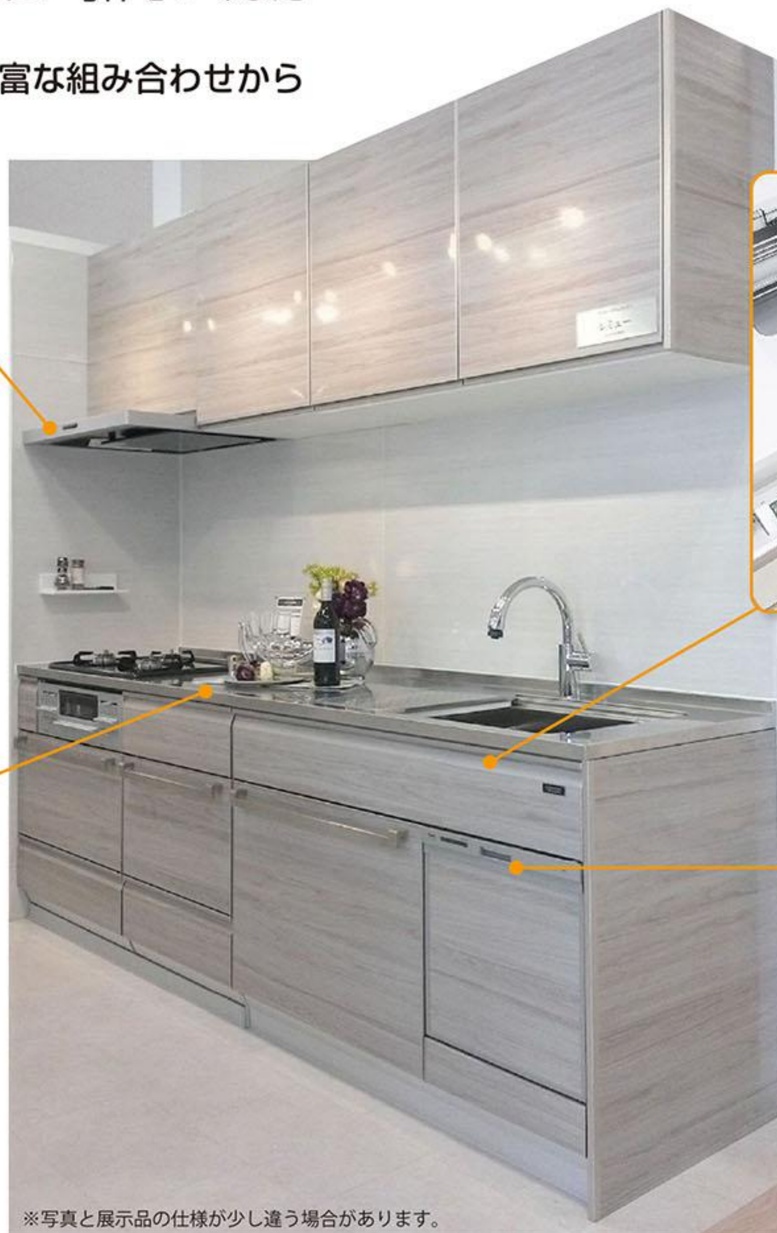
※写真と展示品の仕様が少し違う場合があります。

バイブレーション加工 高級感・上質感・傷を目立たなくするだけでなく「使い込まれた」深い風合いがあります。