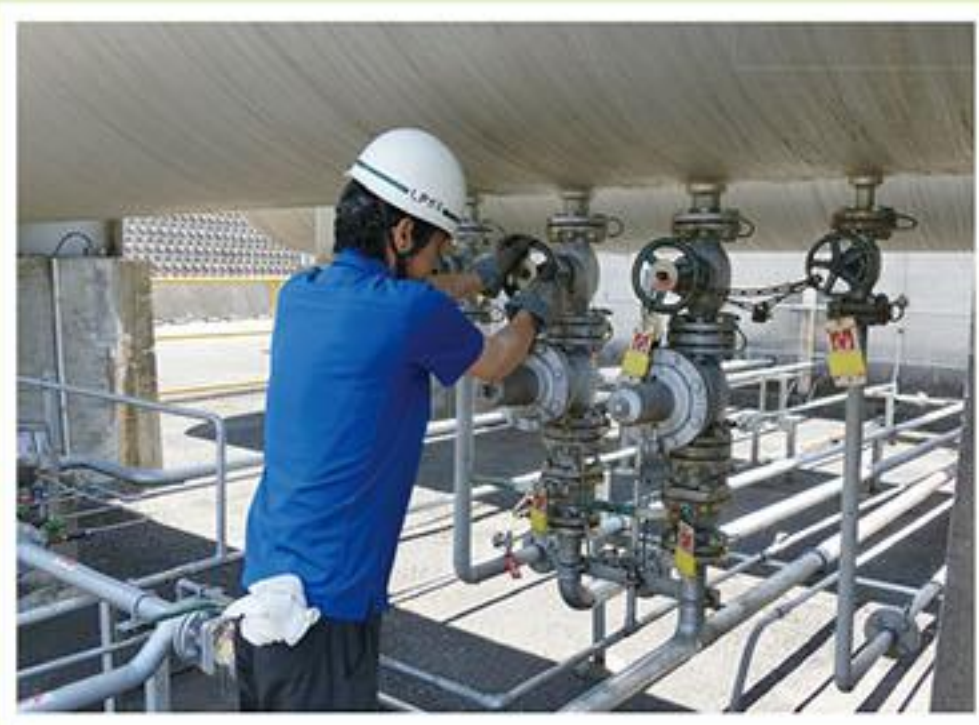
4 2次災害防止のため、タンクバルブ閉止