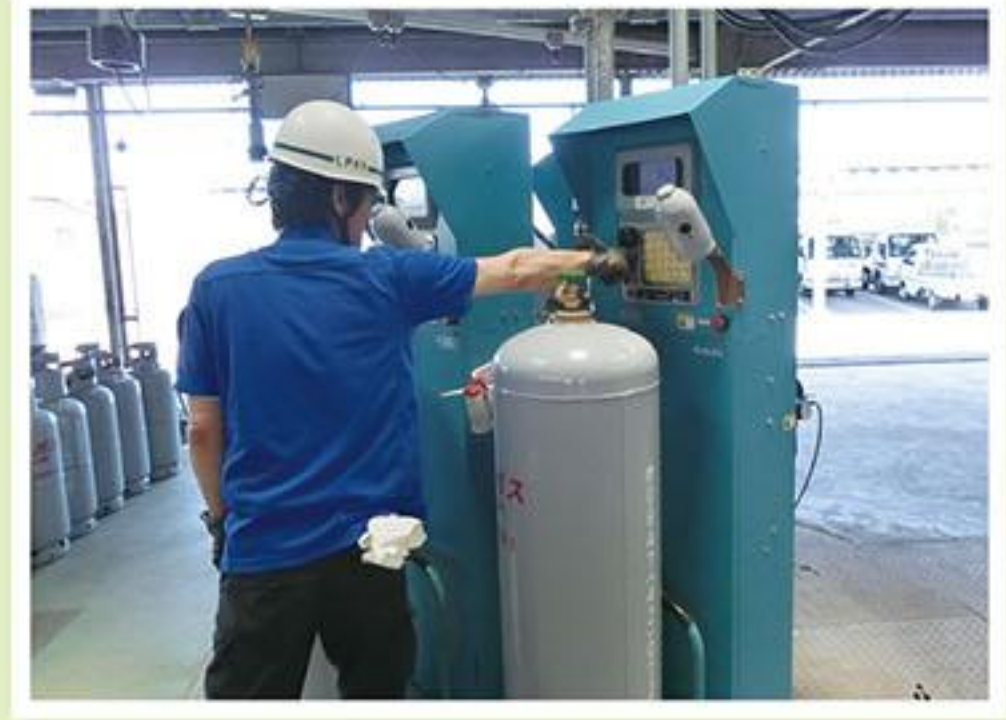
3 ガス漏れ防止のため、充てん作業停止