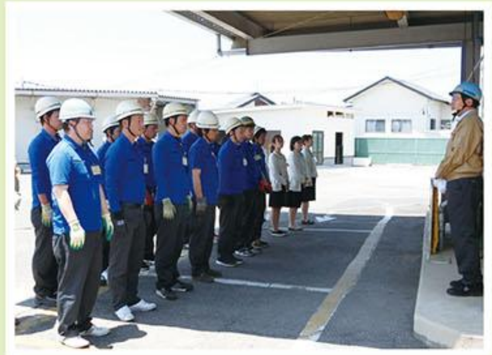
6 隊長へ状況報告し訓練終了