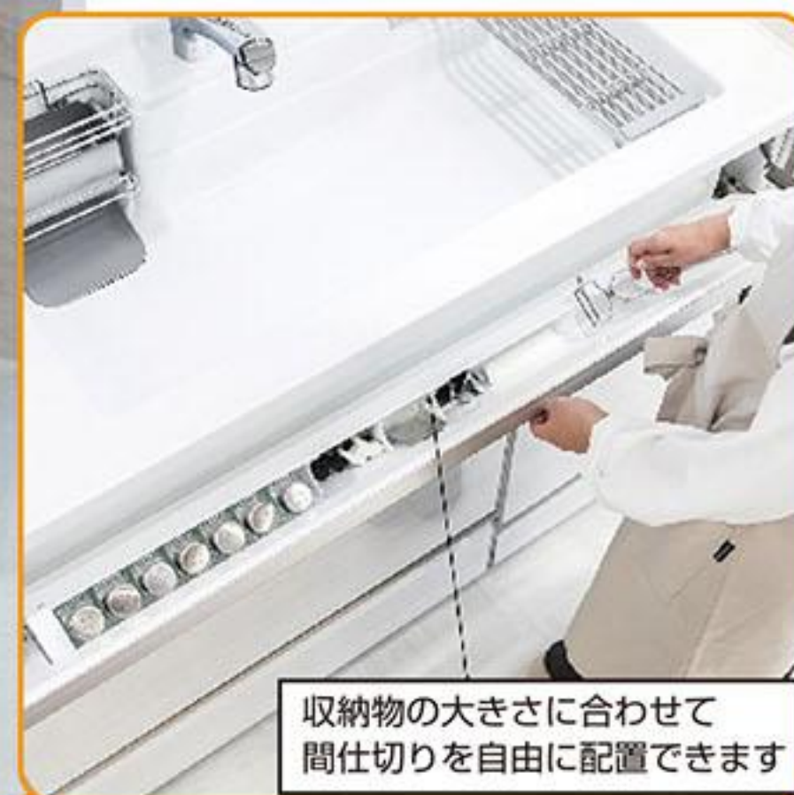
収納物の大きさに合わせて 間仕切りを自由に配置できます