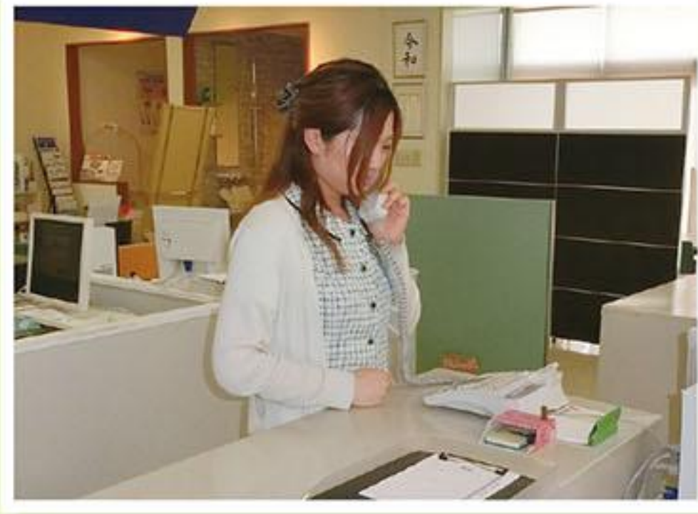
2 地震発生! 外勤社員へ事務所へ戻るように連絡